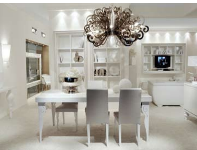
Roma "Casaidea" 2010

Strategie e comunicazione d'avanguardia creano interessanti e suggestivi eventi da non perdere durante le fiere del mobile.