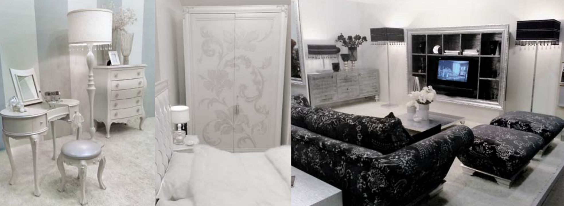
Mosca "Crocus" 2009